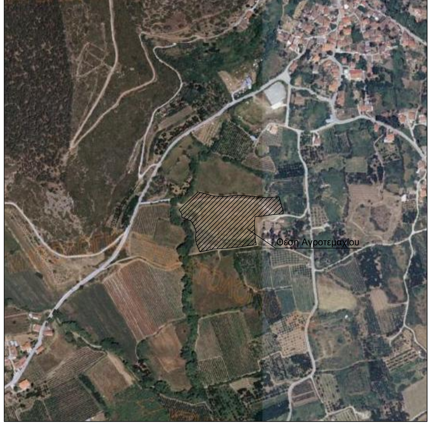
Απόσπασμα Ευρύτερης Περιοχής από Ορθοφωτοχάρτη Κτηματολογίου (Κλίμακα 1:5.000)