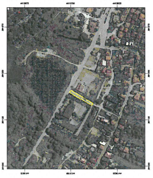
ΑΠΟΣΠΑΣΜΑ ΟΡΘΟΦΩΤΟΧΑΡΤΗ ΑΠΟ ΕΛΛΗΝΙΚΟ ΚΤΗΜΑΤΟΛΟΓΙΟ