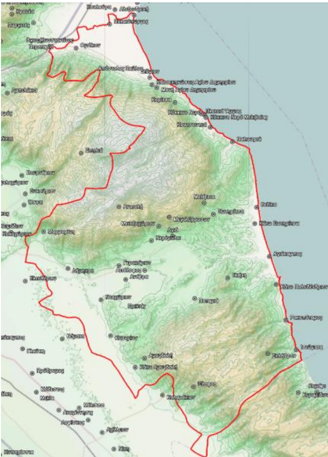
Εικόνα 1: Η θέση του Δήμου Αγίας και η προσήνεμη παράκτια ζώνη αρμοδιότητας του Δημοτικού Λιμενικού Γραφείου του Δήμου.